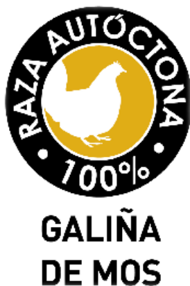
Figura 8. Selo raza autóctona galiña de Mos