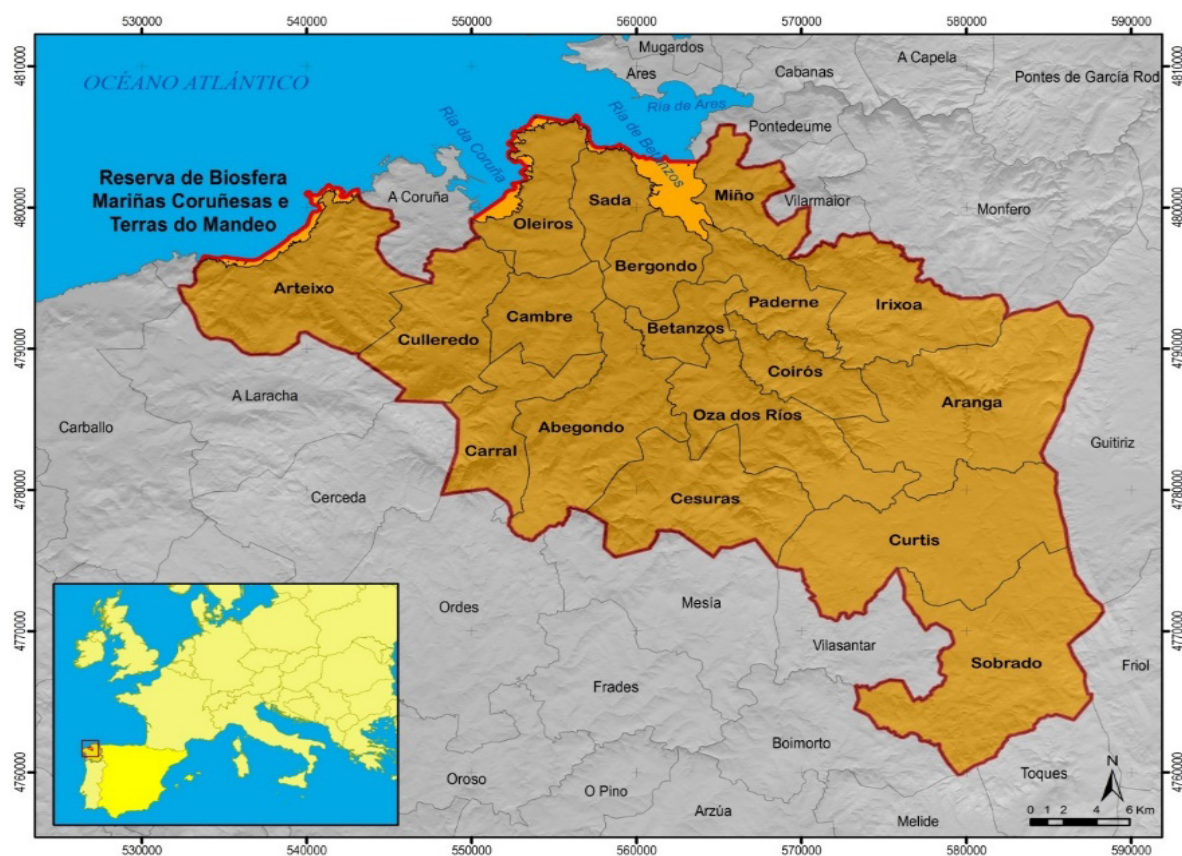
Figura 1. Territorio da Reserva da Biosfera das Mariñas Coruñesas e Terras do Mandeo

Os GDR Seitura 22, Limia-Arnoia, Mariñas-Betanzos, Terra Cha e EU Rural puxeron en marcha o proxecto Nó Rural unha rede para animar a incorporación de persoas no sector primario, fomentar o emprendemento e a mellora da empregabilidade, conectando as empresas das áreas rurais e o talento da mocidade, mellorar a coordinación e o traballo en rede das administracións públicas, empresas, centros educativos e universidades.