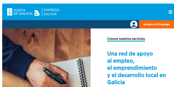
Figura 3. Portal XATEmprego